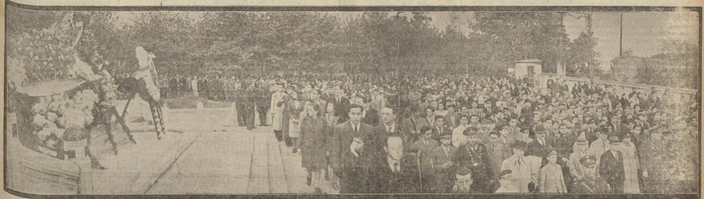
DÜN ŞEHİRİMİZDE YAPILAN İHTİFALDEN BİR İNTİBA: EBEDİ ŞEF ATATÜRKÜN HEYKELİ ÖNÜNDE